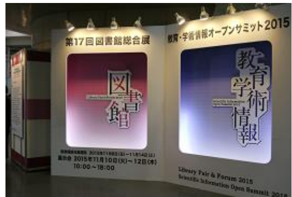
図書館総合展 展示会場の様子